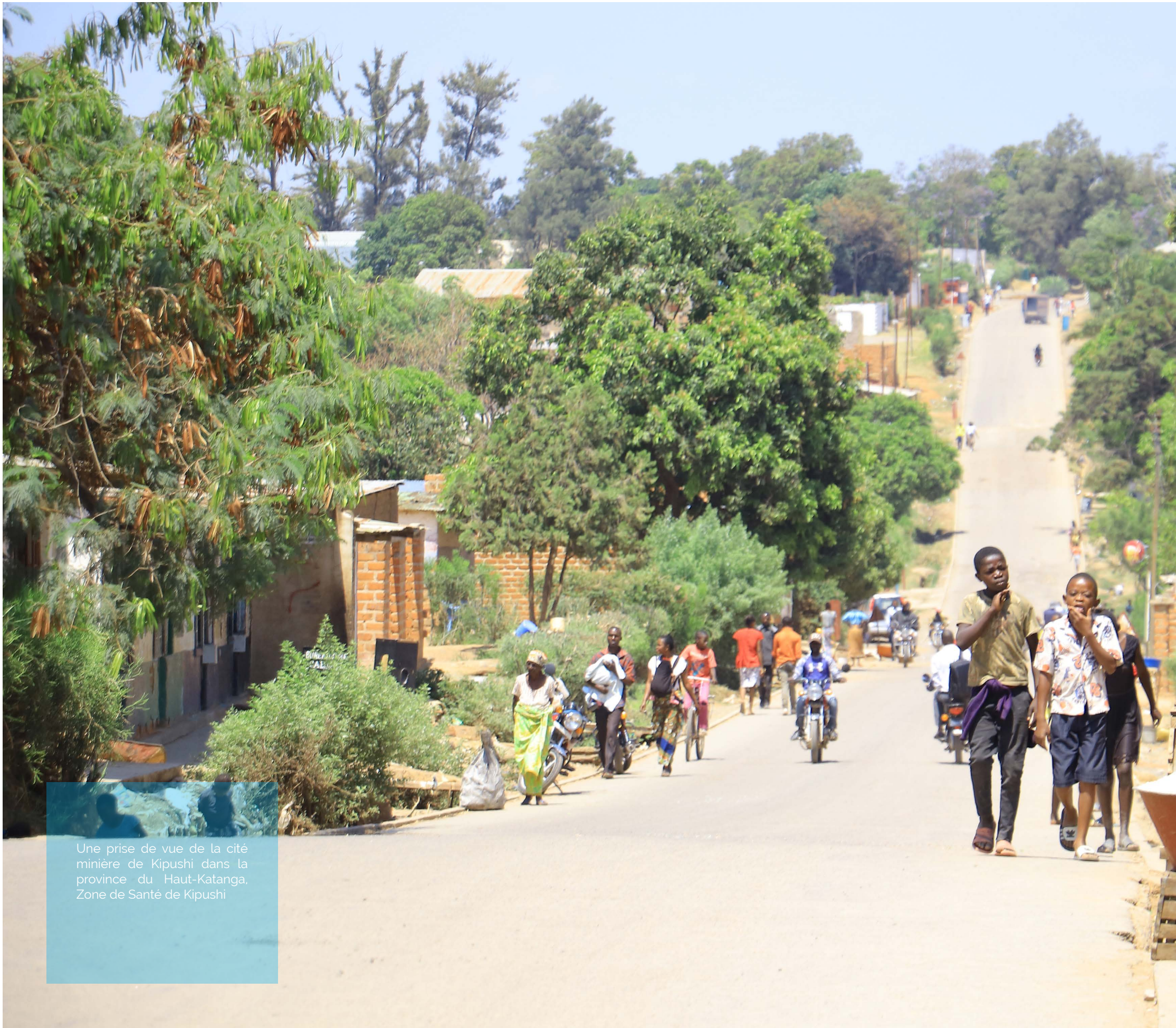
Une prise de vue de la cité minière de Kipushi dans la province du Haut-Katanga, Zone de Santé de Kipushi