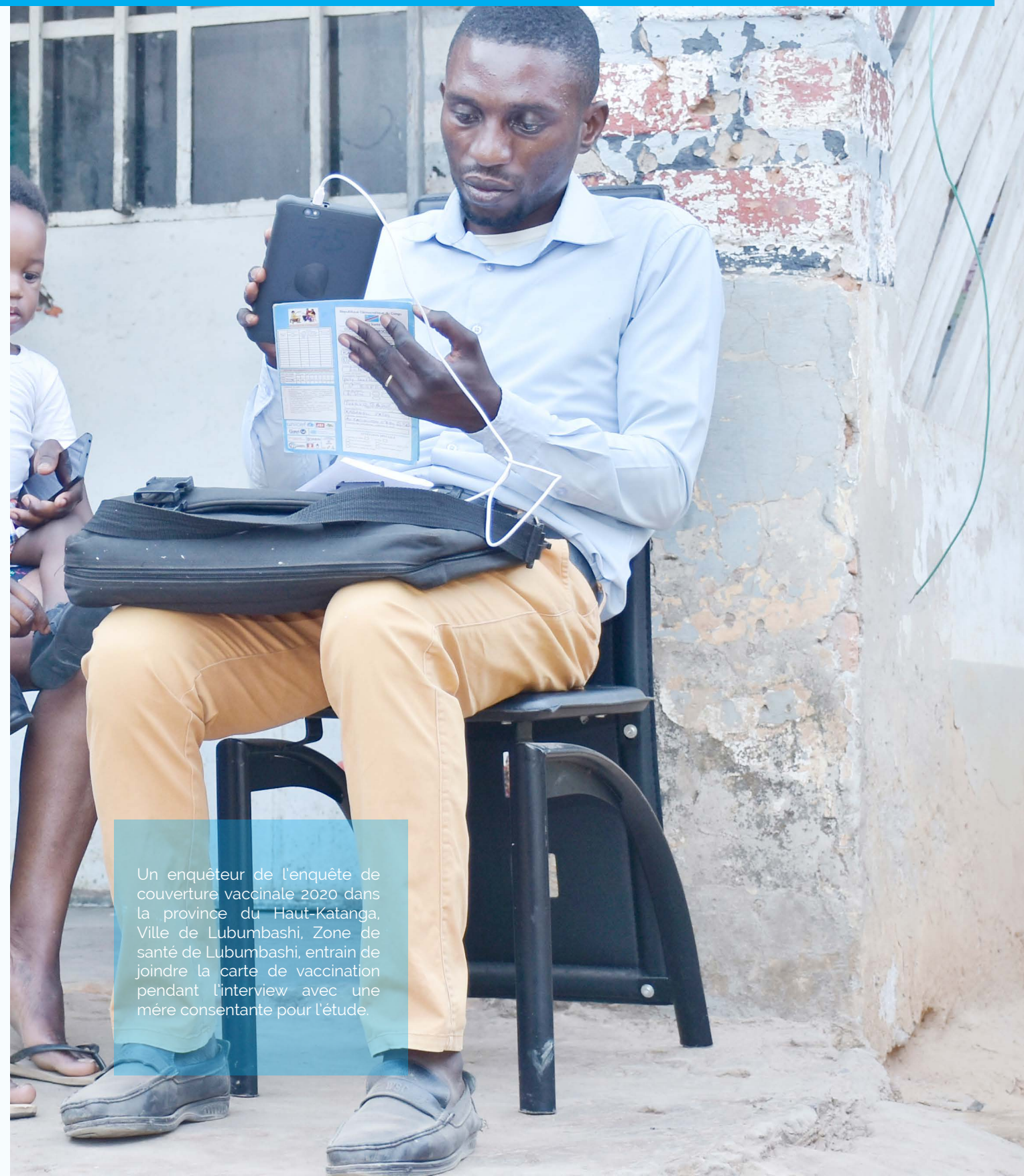
Un enquêteur de l'enquête de couverture vaccinale 2020 dans la province du Haut-Katanga, Ville de Lubumbashi, Zone de santé de Lubumbashi, entrain de joindre la carte de vaccination pendant l'interview avec une mère consentante pour l'étude.

Le dernier jour de la formation des enquêteurs était mis à profit pour pratiquer, en situation réelle, le relevé parcellaire, la sélection des ménages et la collecte des données à l'aide de la tablette électronique. Les enquêteurs devaient réaliser des entretiens individuels sur des cibles réelles dans une aire de santé qui n'était pas incluse dans l'étude. Les résultats du pré-test avaient permis de juger de la maîtrise de la méthodologie de l'enquête par les enquêteurs et de corriger les erreurs.