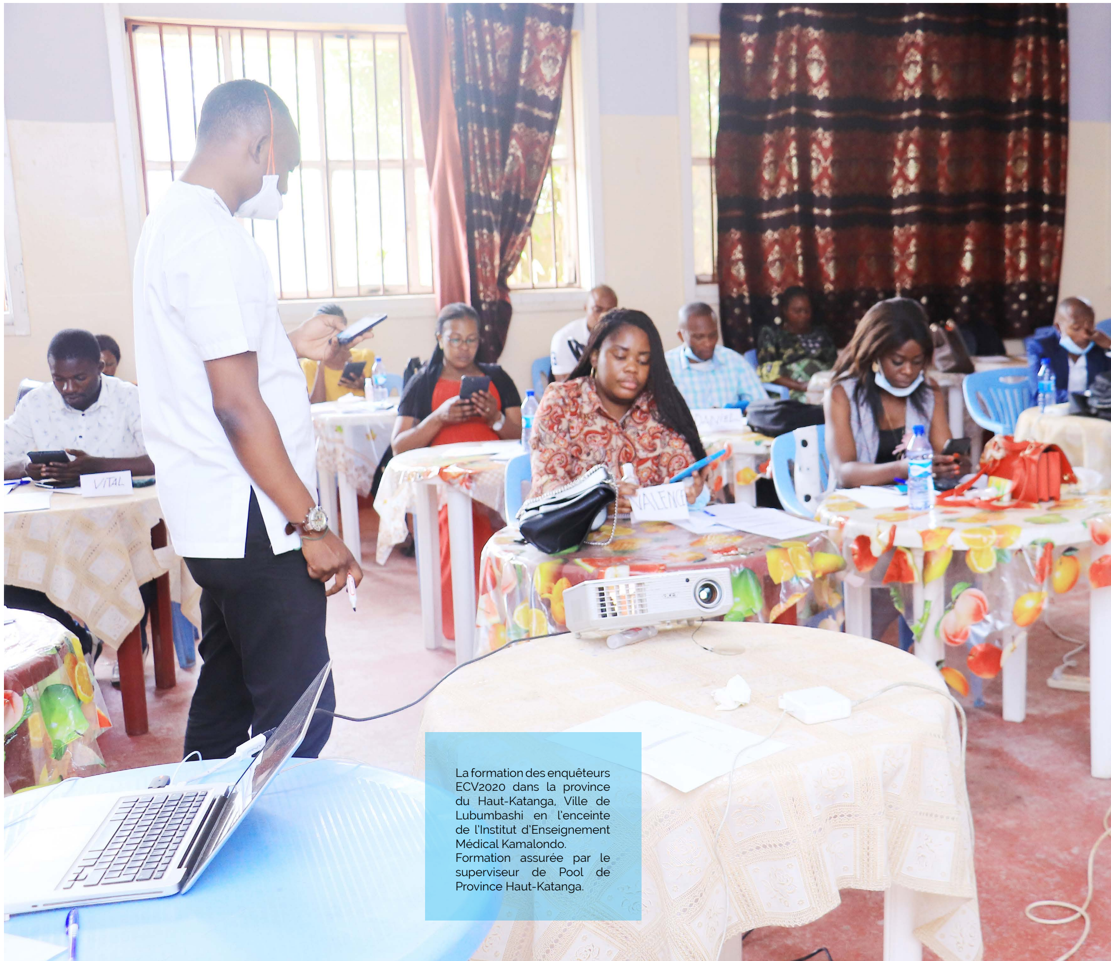
La formation des enquêteurs ECV2020 dans la province du Haut-Katanga, Ville de Lubumbashi en l'enceinte de l'Institut d'Enseignement Médical Kamalondo. Formation assurée par le superviseur de Pool de Province Haut-Katanga.