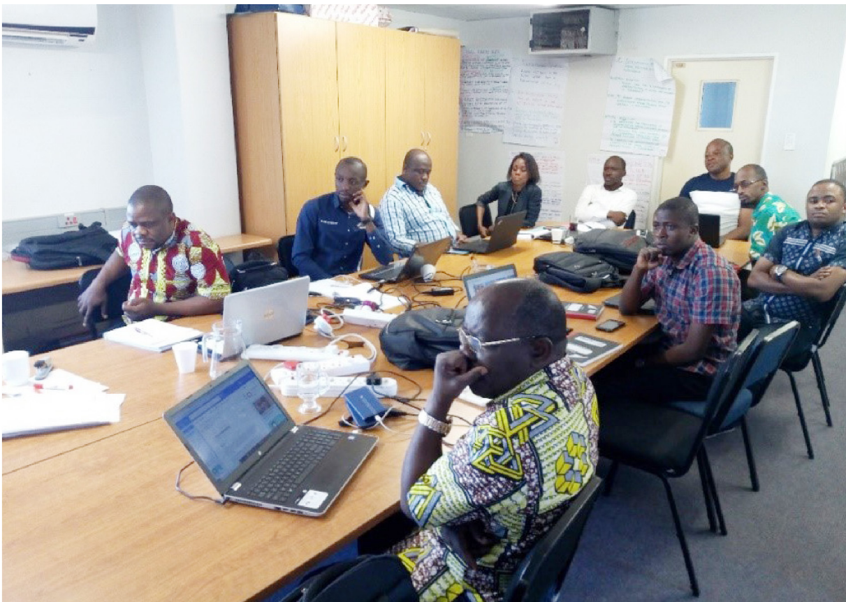
Des étudiants de la quatrième cohorte à Durban en Afrique du Sud lors d'un atelier de recherche

Au cours de l'année 2019, l'ESP a participé quelques conférences scientifiques. Les apprenants de la deuxième année EPINUT ont participé avec les membres du département de Nutrition à un atelier sur la rédaction scientifique avec la collaboration de l'Université de Bergen et de Kwazulu Natal. Cette activité a permis aux participants de développer des compétences pour mieux écrire les protocoles de recherche mais aussi les articles scientifiques.