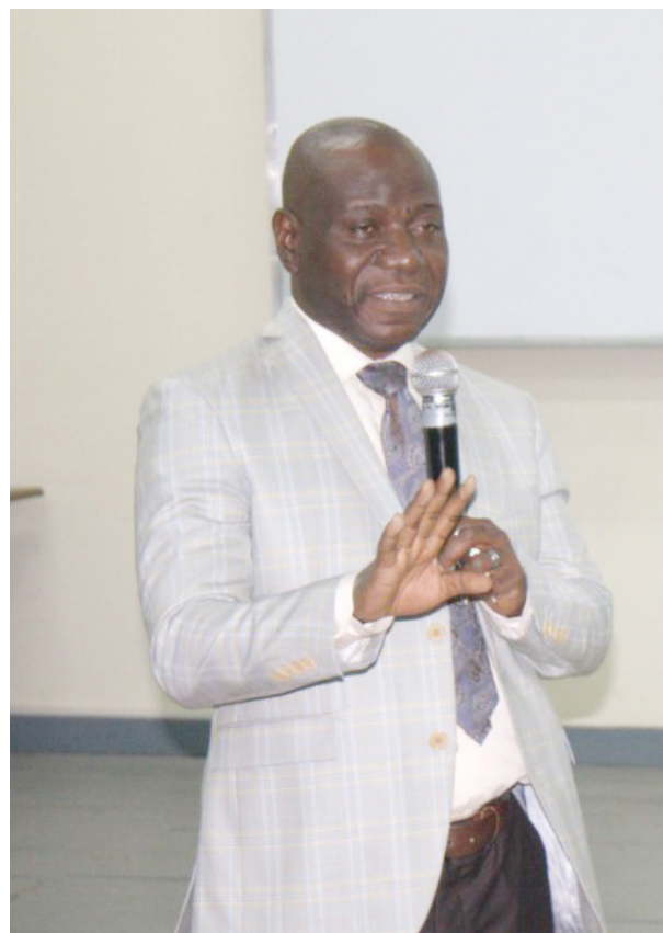
Mot du Directeur et Directeur adjoint de l'ESP lors de la reprise des activités académiques 2019-2020