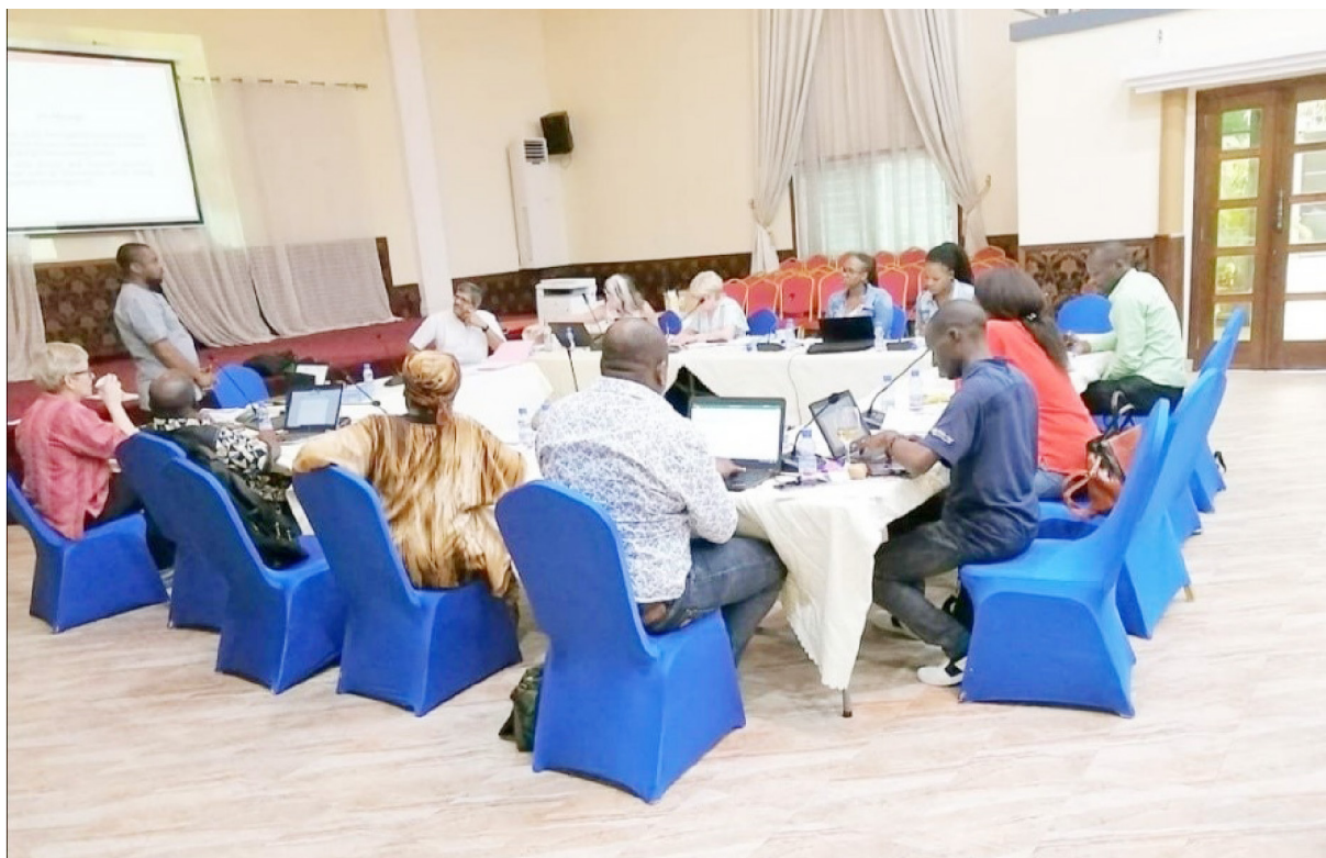
Manuscript writing workshop in drc

L'ESPK a organisé en date du 11 et 12 février 2019, une conférence de restitution des résultats des études sur la nutrition réalisées à Popokabaka dans le cadre du projet « Grownut ».