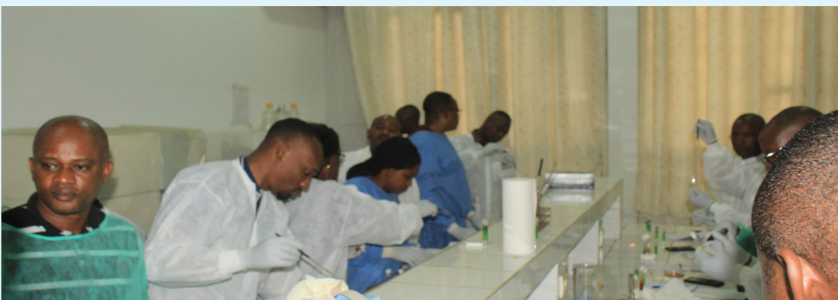
Apprenants lors des séances pratiques de Laboratoire