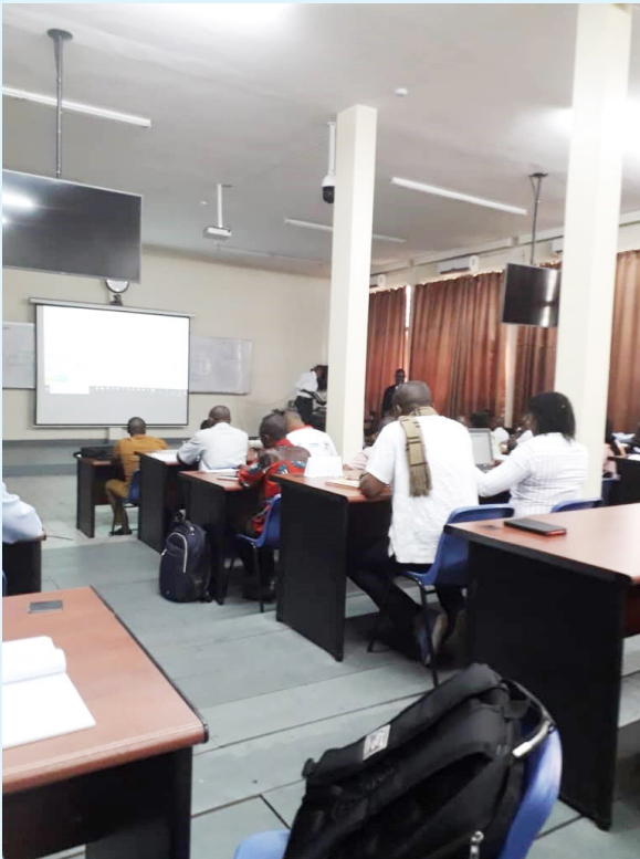
Séance des cours théoriques à l'ESP (2018-2019)

A la fin de l'année académique, les apprenants réalisent les recherches pour la défense de leur mémoire. Dans la meilleure situation, les apprenants défendent leurs mémoires à la première session. Ces défenses interviennent 3 mois après la fin des examens de la 1ere session des examens. A défaut, ces défenses interviennent à la 2e session qui est organisée 3 mois après la première session.