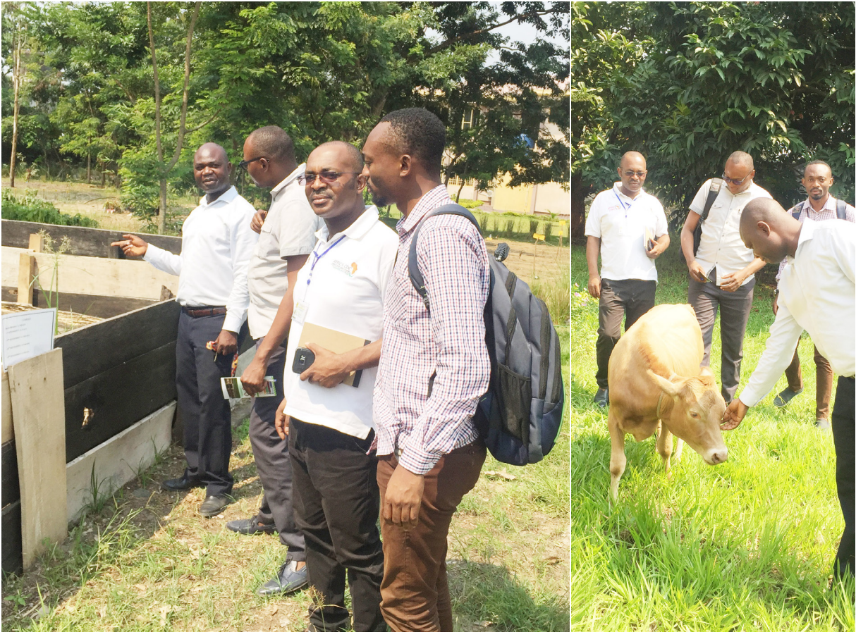
Apprenants 31ème promotion SAPU lors d'un terrain de Santé Environnement