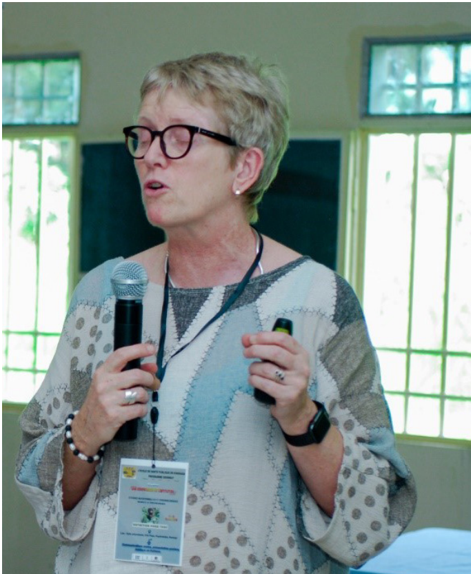
Allocution du directeur de l'ESPK et de la représentante du projet Grownut