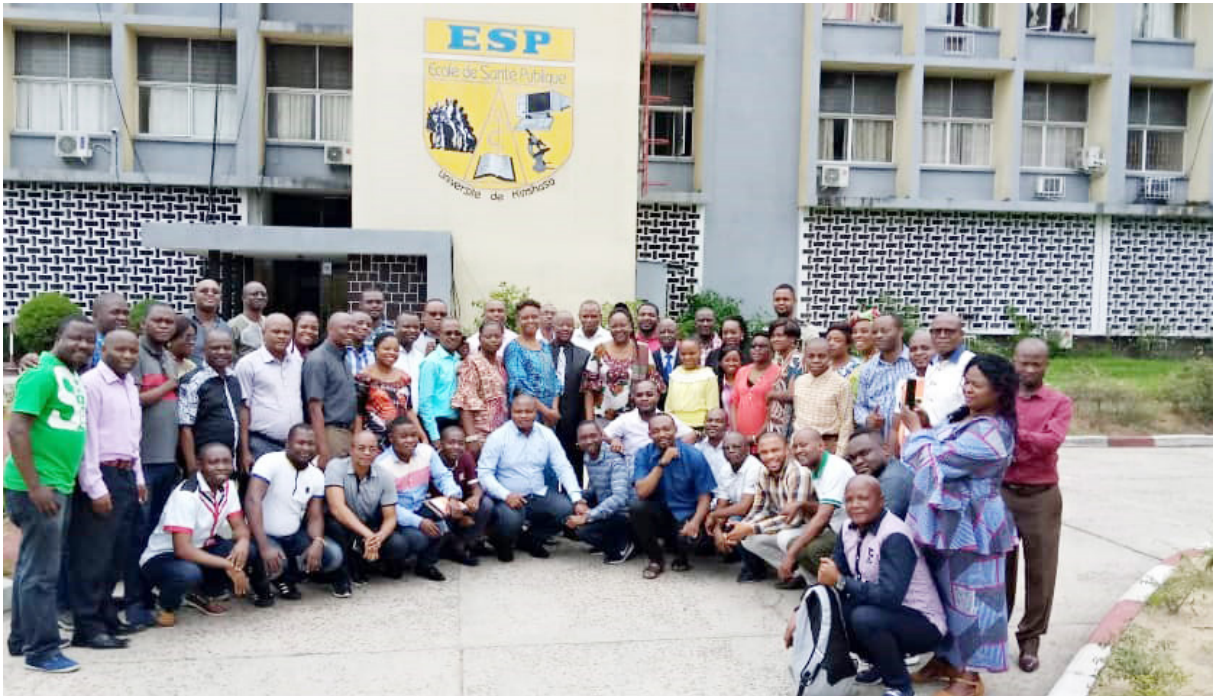
Figure : Fin des enseignements théoriques de la 31eme promotion SAPU (2018-2019)