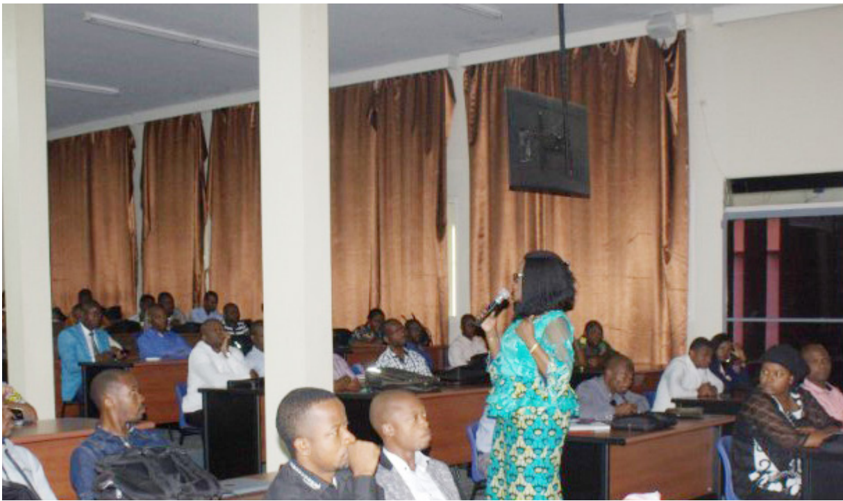
Mot du chargé de la formation aux apprenants